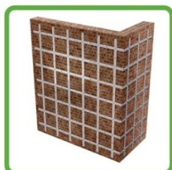
ANTIRIBALTAMENTO A SECCO