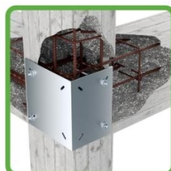
PIASTRE CONFINAMENTO NODO