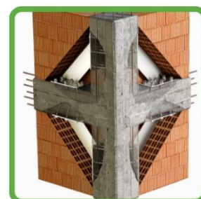
PROTEZIONE DEL NODO