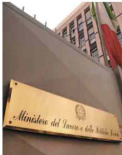
Il ministro del lavoro

Cultura della sicurezza. È fondamentale sviluppare, già nelle giovani generazioni, una cultura che faccia acquisire la consapevolezza dell'importanza della sicurezza sul lavoro partendo dall'inserimento della materia nell'ambito della didattica scolastica. Prevenzione e tutela della sicurezza e salute devono divenire patrimonio culturale dei datori di lavoro, a cui vanno indirizzati specifici e interventi formativi. Al fine di semplificare razionalizzare il dialogo con le strutture pubbliche sarebbe peraltro fondamentale costituire uno sportello unico integrato per la Sicurezza, a cui le imprese possano rivolgersi per ogni aspetto legato ai temi della prevenzione e della sicurezza e salute sui luoghi di lavoro, e che funzioni da collettore del sistema. La proliferazione di comitati e commissioni, nazionali e a livello territoriale, con funzioni rilevanti di programmazione strategica e coordinamento ovvero consultive, la previ-