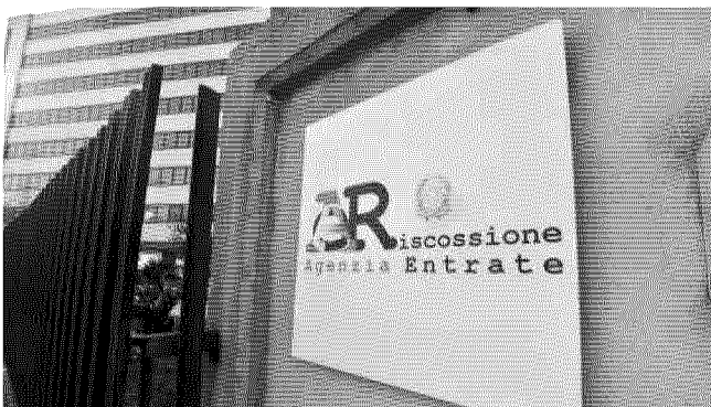
La sede dell'Agenzia delle entrate