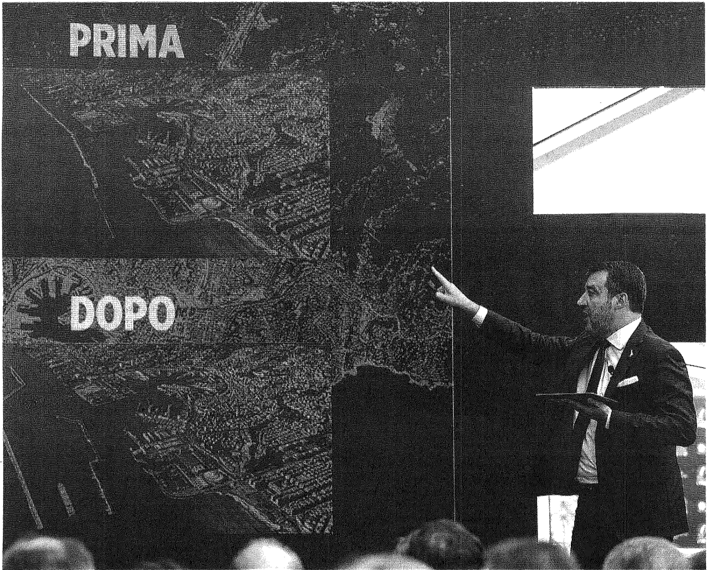
A Roma Matteo Salvini, 50 anni, ministro delle Infrastrutture e dei trasporti, ieri all'evento «L'Italia dei sì. Progetti e grandi opere per il Paese»