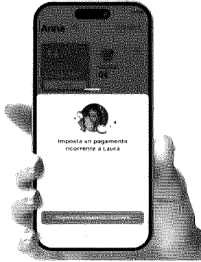
La paghetta è digitale per Satsipay