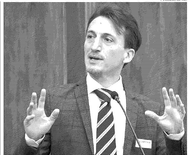
La strategia sull'utilizzo della IA. Il presidente del Comitato Gianluigi Greco

Palazzo Chigi ha nominato padre Benanti (in foto) a capo del pool che valuterà l'impatto della IA sull'editoria. Benanti sostituisce Giuliano Amato.