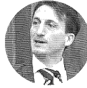
Gianluigi Greco. Presidente del Comitato per la strategia nazionale sull'utilizzo dell'intelligenza artificiale

L'intervista. Gianluigi Greco. Presidente del Comitato per la Strategia nazionale sull'utilizzo dell'Intelligenza Artificiale: puntiamo ad aumentare il numero di start up, per loro possibili sperimentazioni deregolate