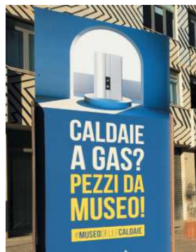
Campagna contro le caldaie