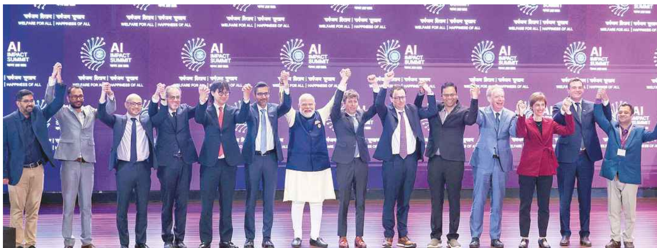
La foto di gruppo e la rivalità Altman-Amodei. Il premier indiano Narendra Modi, al centro, con alcuni tra i maggiori leader tech globali. Alla sua sinistra (a destra nella foto) i Ceo di Open AI, Sam Altman, e di Anthropic, Dario Amodei, evitano di prendersi per mano: una rappresentazione plastica delle divisioni tra i big del settore.

Ritaglio stampa ad uso esclusivo del destinatario, non riproducibile.