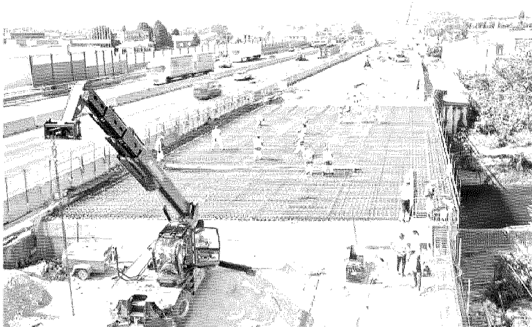
Autostrade per l'Italia. Prosegue l'impegno di Aspi nel potenziamento e ammodernamento della rete: previsto anche l'impiego di materiali di ultima generazione