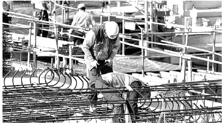
Switch off. Dal 1° gennaio dematerializzazione dei bandi di gara