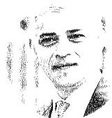
Sadiq Khan. Sindaco di Londra dal 9 maggio 2016