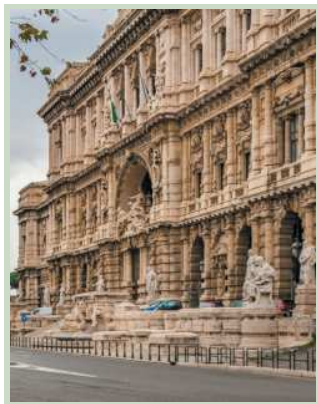
La Corte di cassazione