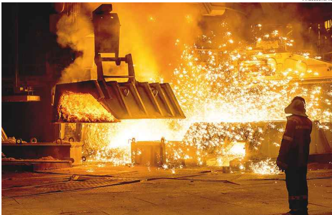
«Dovete agire». È l'appello lanciato ai 27 capi di stato e di governo un appello dalle industrie energivore europee

Ritaglio stampa ad uso esclusivo del destinatario, non riproducibile.