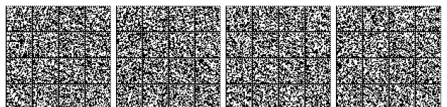
Tabella V.14-2: Compartimentazione