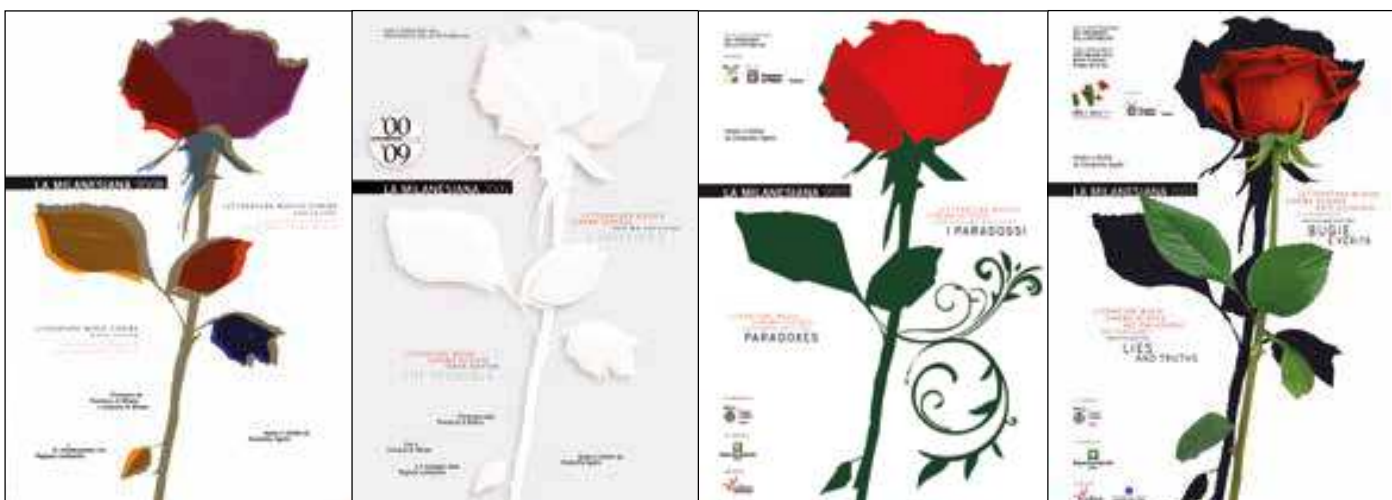
I QUATTRO ELEMENTI FUOCO ARIA TERRA ACQUA