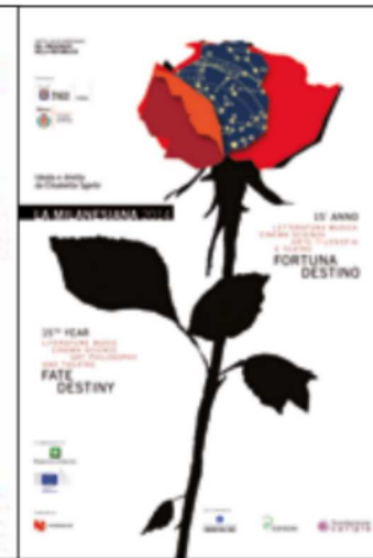
FORTUNA E DESTINO