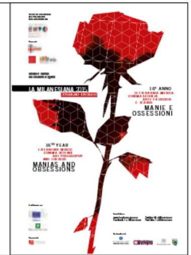
MANIE E OSSESSIONI