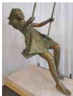
scultura di Leonardo Lucchi