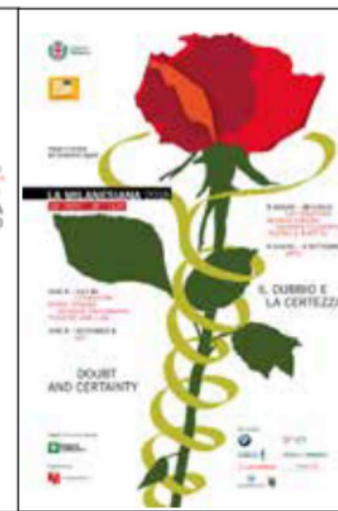
IL DUBBIO E LA CERTEZZA