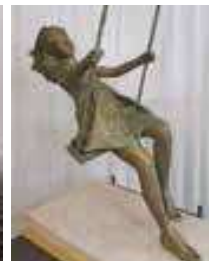
scultura di Leonardo Lucchi