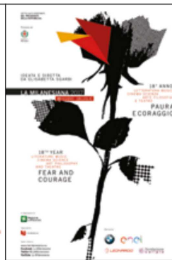
PAURA E CORAGGIO