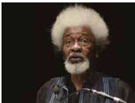
Wole Soyinka, Milanesiana 2015