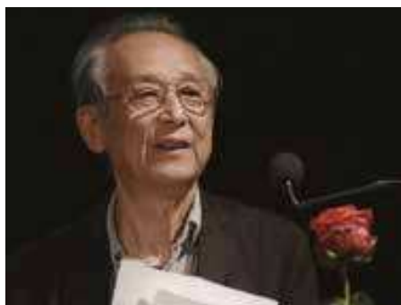
Gao Xingjian, Milanesiana 2014