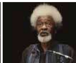
Wole Soyinka, Milanesiana 2015