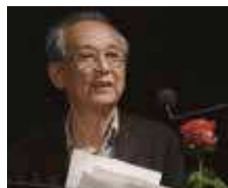
Gao Xingjian, Milanesiana 2014