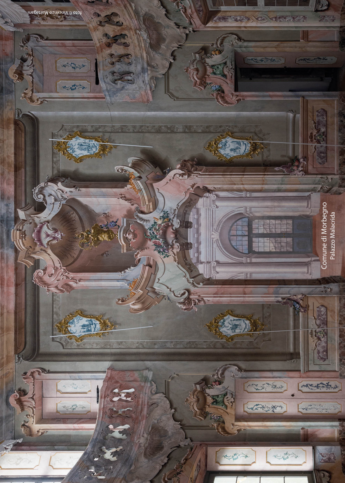
Comune di Morbegno Palazzo Malacrida