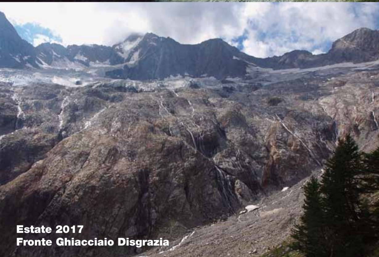
Estate 2017 Fronte Ghiacciaio Disgrazia